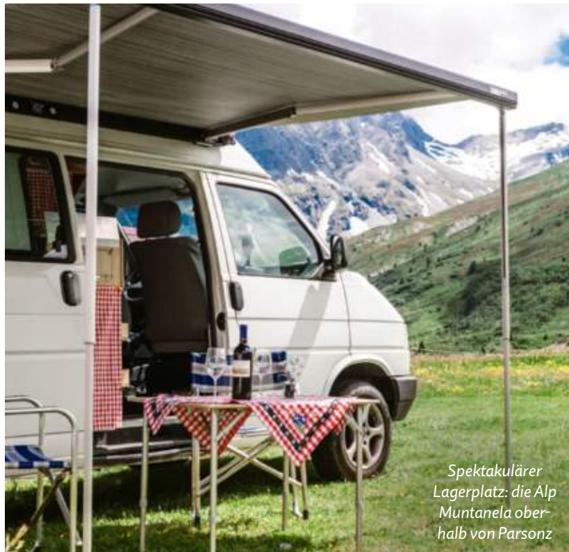
Spektakulärer Lagerplatz: die Alp Muntanela oberhalb von Parsonz

Highlights: Einmalige Aussicht auf die umliegenden Berge; ein Canyon in 10 Gehminuten, ein Bergsee 1,5 Stunden entfernt